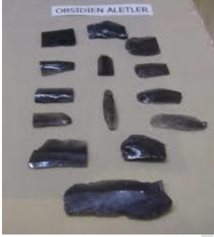
Samsun Tekkeköy Kazıları Obsidien Aletler

Paleolitik Çağın bir üst aşamasına ise Mezolitik çağ denir. Bu dönemde insan, alet çantasını daha da zenginleştirmiş, yaşamını kolaylaştırmaya çalışmıştır. Yontma taş endüstrisi daha ince bir işçilik kazanmış, alet boyları oldukça küçülmüştür. "Mikrolit" olarak adlandırılan geometrik biçimli minik nesnelerin, boynuz, kemik, odun türünden maddelerden yapılmış saplara dizilerek, orak benzeri aletler gibi kullanıldığı biliniyor